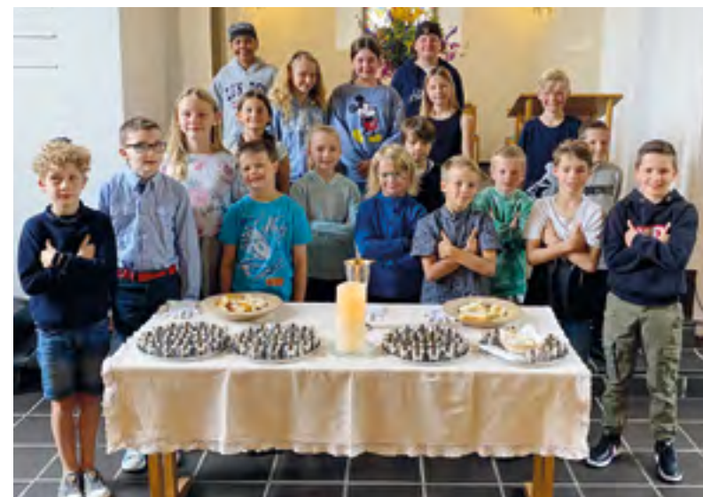
3. Klass-Uni-Kinder am Gottesdienst vom 4. Juli