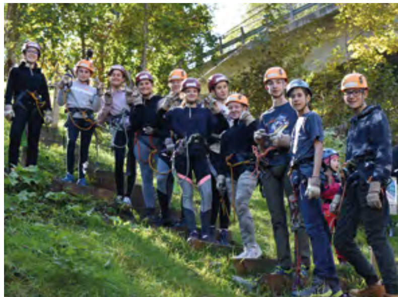
Konflager in Adelboden vom 4.-10. Oktober

20. Nov. Niederglatt (ref. Kirche) 5. Feb. (ref. Kirchen Embrachertal und FEG Gemeinde) reachourregion.ch